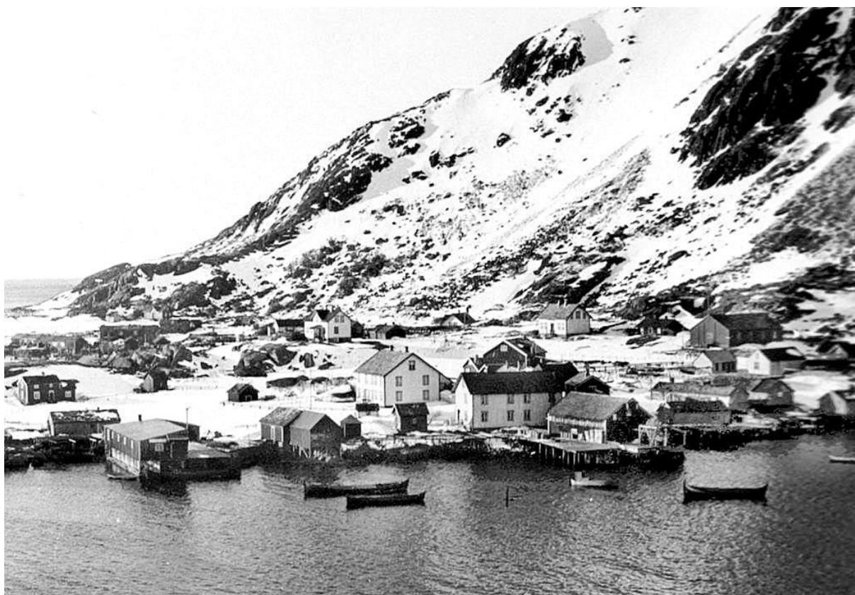
Væreiergården på Ballstadlandet